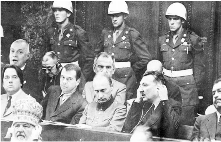
Скільки нас отаких попід муру Од червоної кулі лягло.

І пішов я тоді до Петлюри, Бо у мене штанив не було,